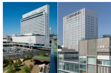
ホテルグランヴィア広島 (JR 広島駅新幹線口直結)

広島駅新幹線口に直結する「ホテルグランヴィア広島」と、2025年3月24日に開業し、広島駅直上にある瀬戸内を繋ぐ新たな旅の基点「ホテルグランヴィア広島サウスゲート」。最高のロケーションに位置し、世界遺産として名高い「厳島神社」や「原爆ドーム」へもホテルに隣接する公共交通機関でアクセス可能、ビジネスにも便利です。都会のオアシスでゆったり快適なプライベート空間をお過ごしいただけます。二館合わせて広島地域最大級のシティホテルとして、お客さま一人ひとりに寄り添ったおもてなしをいたします。