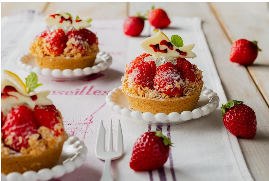
高校生が考案したアイデアをもとに開発した「鯉恋チーズタルト」

ホテルグランヴィア広島（広島市南区松原町 1-5、総支配人：島田正義）は、バレンタインデーとホワイトデーを含む 2026 年 2 月 1 日（日）～3 月 15 日（日）の期間、いちごの王様「あまおう」と、広島レモンを使用した「鯉恋チーズタルト」を 2 階パティスリー「ディッシュパレード」にて期間限定で販売いたします。