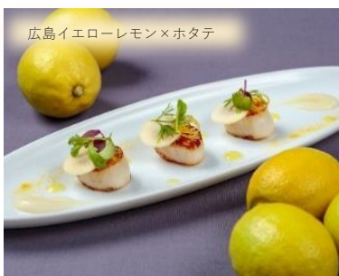
広島イエローレモン×ホタテ フレンチコースで、ホタテ貝柱のポワレ レモンバターソースをどうぞ。