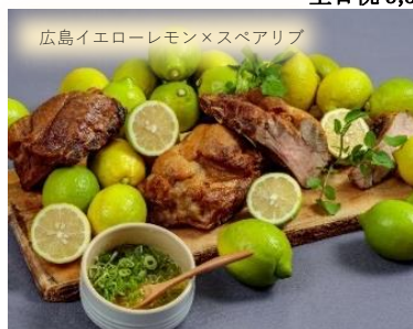
広島イエローレモン×スペアリブ 月替わりのメインディッシュ 1月はスペアリブ ネギ塩レモンだれが登場

カフェ&ブッフェ デイッシュ パレード ニューノーマルランチブッフェ 平日 3,000円 土日祝 3,500円