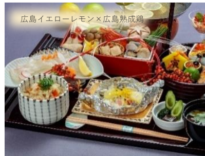
広島産レモンと県産鶏のホイル焼きや、寄せ 鍋風レモン鍋など、レモンを満喫する昼膳。