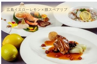
豚スペアリブと広島産レモンの紹興酒煮込み、 広島産レモンの香り蒸し潮洲粥をコースでご提供。