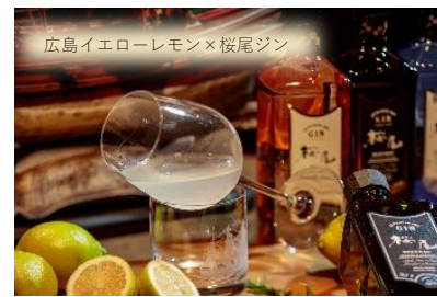
広島を代表するジン「桜尾」と広島イエローレモンの 柔らかい口当たりが特徴のカクテルです。