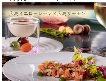
広島サーモンと広島産レモン風味のバターソース 等、♯は広島菜のガーリックライス発イメーজ画像です。