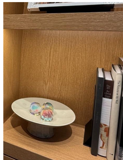
エントランスでは、瀬戸内にまつわる書籍やアート（左）、 広島を象徴する「水」をイメージしたプリズムボール（右）がお客さまをお迎え