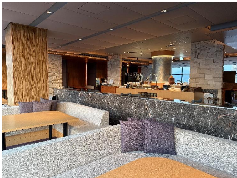
ゆったりとした空間を引き立てる、 ラウンジの中央の瀬戸内の青を表現した箔装飾の柱（右奥）