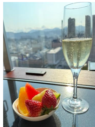
朝食でお楽しみいただけるご注文ごとに調理する牛肉のステーキやスクランブルエッグ（左）、 広島の街並みを眺めながらのスパークリングワイン（右）