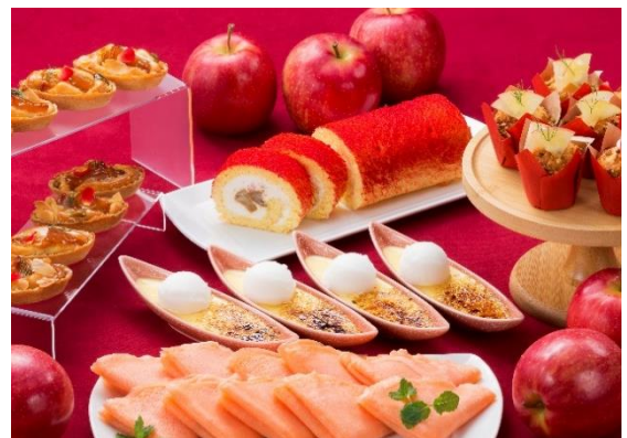
高野りんごを使用したスイーツイメージ