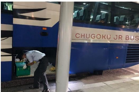
貨客混載バスが広島駅に到着した様子

貨客混載の取り組みは、庄原市と西日本旅客鉄道株式会社 広島支社により2018年に開始され庄原市高野町の認知度向上（エリアブランディング）や地域製品の消費拡大を通じた、地域活性化事業です。