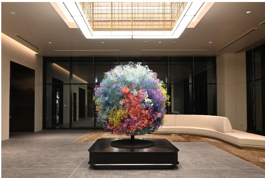
瀬戸内の春を彩るサスティナブルなロビー空間 ～「ホテルグランヴィア広島サウスゲート」3/24（月）開業～

新しい広島駅ビルの西側に開業する JR 西日本ホテルズの新ホテル「ホテルグランヴィア広島サウスゲート」（以下「サウスゲート」）のロビーでは、開業日となる 2025 年 3 月 24 日（月）より、売れ残り等で本来廃棄されるはずの花や規格外の花を利活用したドライフラワー装飾を設置します。四季ごとにその季節をイメージしたカラフルな装飾で、訪れる皆さまを四季折々の魅力でお迎えいたします。