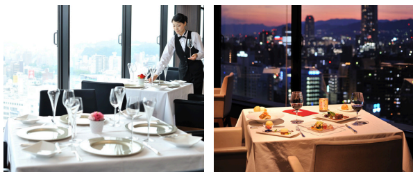
昼&夜のテーブル席